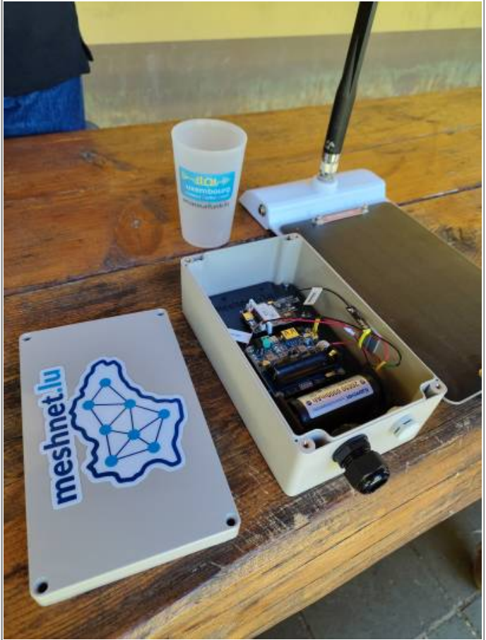
2026/06/22 12:28 · virii news , meshcore