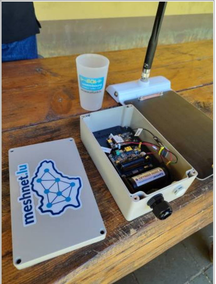
2026/06/22 12:28 · virii news , meshcore