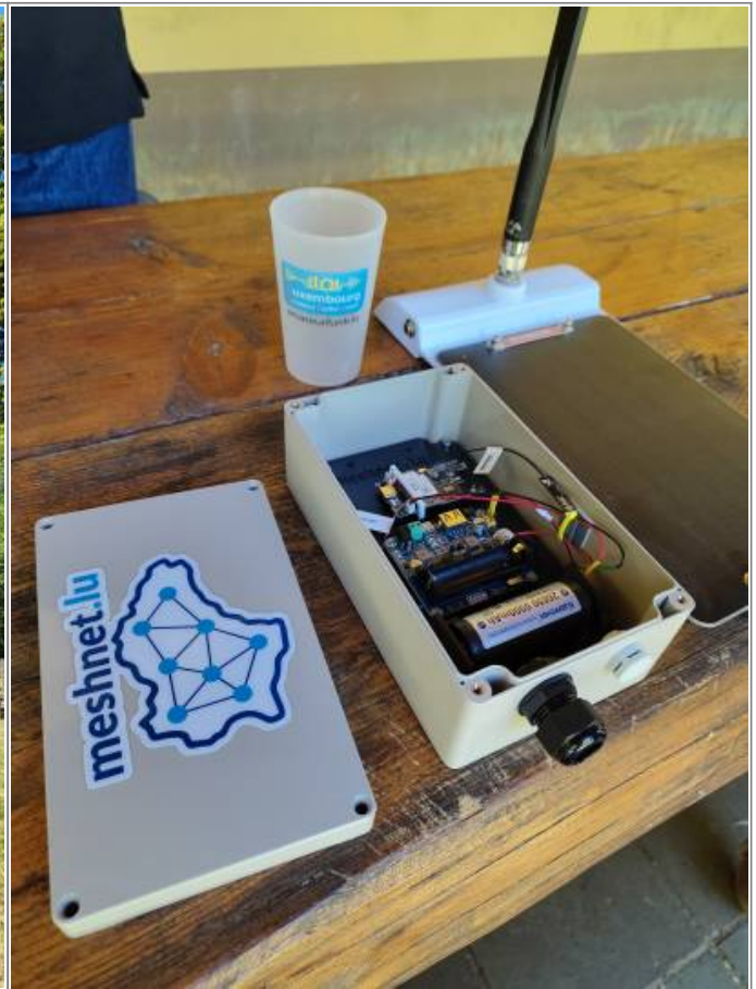
2026/06/22 12:28 · virii news , meshcore