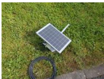
10W Solarmodul & 6dbi Antenn mat integréiertem Bandpassfilter

Uganks Juni war et souwäit, a mir konnten an zesummenaarbecht mat der DEA (Distribution d'Eau des Ardennes), eng Rëtsch nei Meshcore Repeater montéieren. Déi Nodes hëllefen massiv dobäi, den Norden vum Land ofzedecken, sou datt zum Beispill an enger Kris, eng séier, reliabel an autonom Kommunikatioun kann gewährleescht ginn!