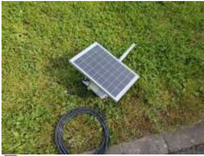
10W Solarmodul & 6dbi Antenn mat integréiertem Bandpassfilter